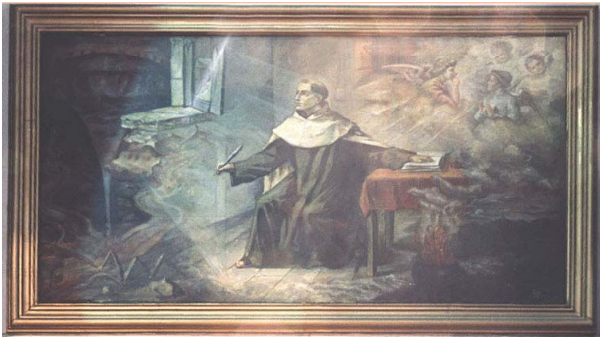
Imagen en la iglesia del convento de Carmelitas Descalzos (Santander) España